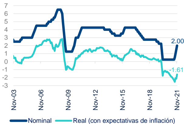
Gráfico 1. TASA DE INTERÉS DE REFERENCIA NOMINAL Y REAL (%)

En la reunión de hoy, el Directorio del Banco Central de Reserva del Perú (BCRP) decidió elevar la tasa de interés de referencia de la política monetaria de 1,50% a 2,00%, en línea con el consenso de mercado. La tasa en términos reales se elevó así de -2,1% a -1,6% (ver Gráfico 1). Luego de este ajuste, que sigue a otros dos consecutivos de la misma magnitud en setiembre y octubre, la posición monetaria sigue siendo expansiva.