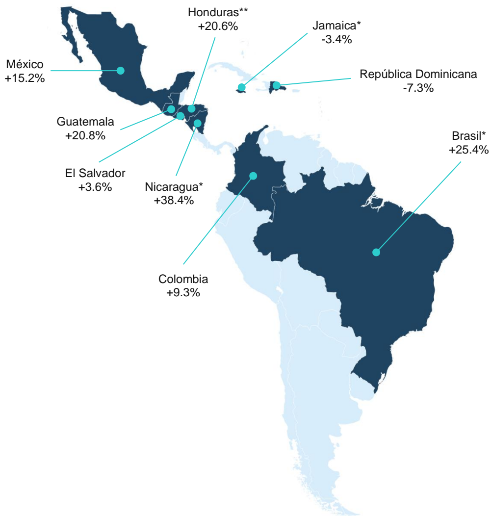
Mapa 1. REMESAS A PAÍSES SELECCIONADOS DE AMÉRICA LATINA Y EL CARIBE, ENERO A AGOSTO DE 2021 VS. ENERO A AGOSTO DE 2022 (Variación %)

Nota: * Período de comparación de enero a julio. ** Período de comparación de enero a junio.