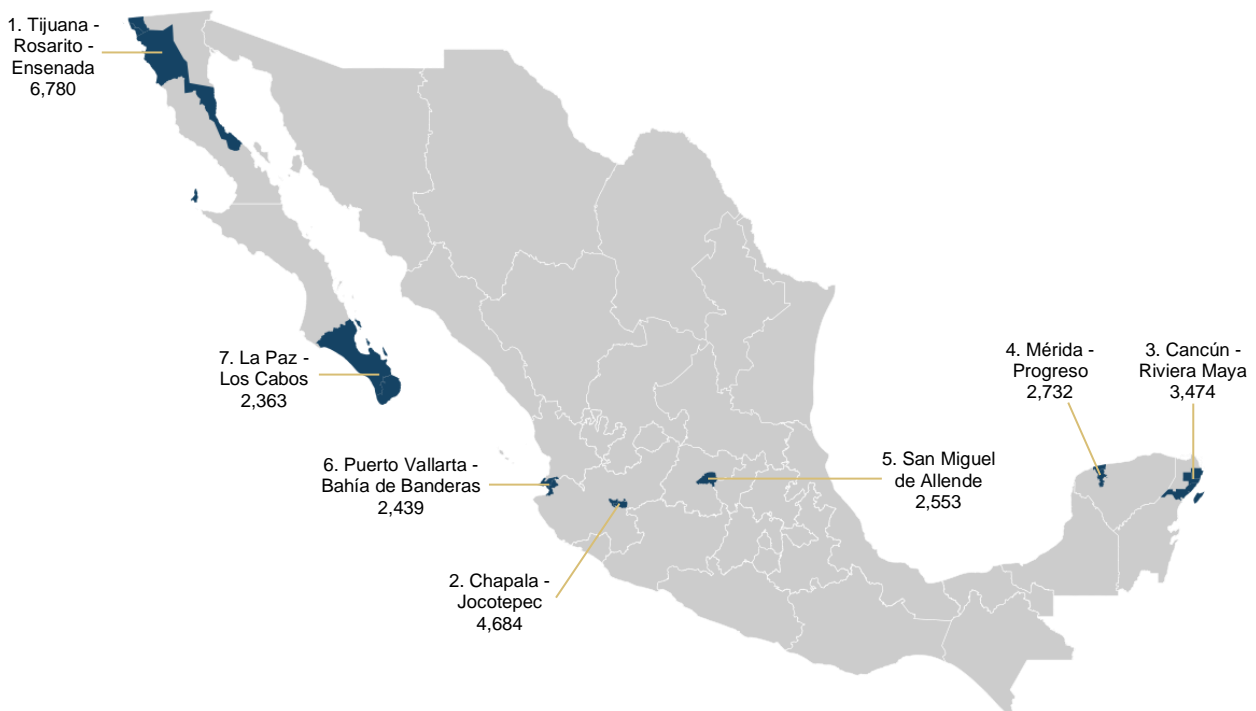
Mapa 1. PRINCIPALES ZONAS DE RESIDENCIA DE LA POBLACIÓN DE 60 AÑOS O MÁS NACIDA EN EL EXTRANJERO, 2020 (Población)

Nota: Se excluyeron a las grandes metrópolis de México.