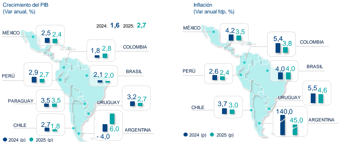
Gráfico 2. PREVISIONES EN LATAM

La inflación se ubica ya por debajo del promedio de los últimos 10 años en la mayoría de países de la región, salvo Argentina y Colombia. Uruguay, por el contrario, ha logrado encauzar la evolución de precios al rango objetivo. Sin embargo, para el resto de los países se evidencia una mayor persistencia de la esperada, lo que lleva a una revisión al alza en la inflación esperada para 2024 en la mayoría de países. Para 2025, no obstante, se espera que la convergencia gradual a la meta continúe en la mayoría de economías de la región. En Uruguay la inflación continuará curvando hacia el centro del rango meta del BCU, alcanzando 5,5% este año y 5,0% en 2025.