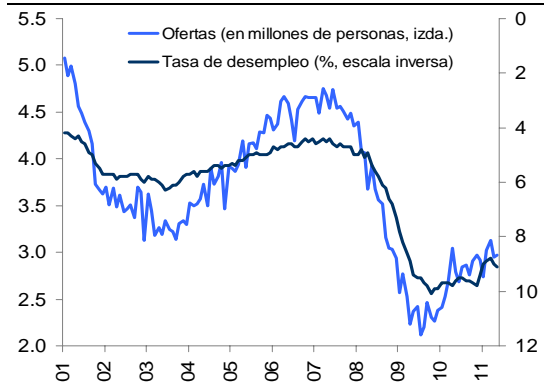
Gráfica 1 Ofertas de trabajo y desempleo

Los datos de ofertas de trabajo y rotación laboral de mayo indican un débil crecimiento del mercado de trabajo ya que las tasas de contratación y ofertas de trabajo permanecieron relativamente sin cambios, mientras que la tasa de despidos aumentó a 3.1%. La brecha entre contrataciones y despidos se redujo significativamente en 11 mil a partir de una brecha revisada de 168 mil del mes pasado, agravándose la falta de creación de empleo en el sector privado. El número de renunciaciones siguió aumentando en mayo, permaneciendo por encima del nivel de despidos y bajas, lo que sugiere que los individuos creen que hay trabajos disponibles. Aunque la relación de personas desempleadas por oferta de trabajo descendió 4.7%, el número es aún alto comparado con el nivel previo a la recesión de 1.8%. La curva de Beveridge, que no muestra cambios en la tasa de ofertas de trabajo y un incremento de la tasa de desempleo de 9.1%, puede indicar la ineficacia del mercado de trabajo debido al desajuste entre las ofertas disponibles y los desempleados. La reciente volatilidad de la varianza del desempleo sectorial relativo, que mide el desempleo estructural, sugiere incertidumbre en el crecimiento del empleo para los próximos meses.