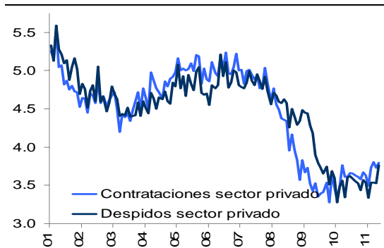
Gráfica 3 Contrataciones y despidos del sector privado, en millones