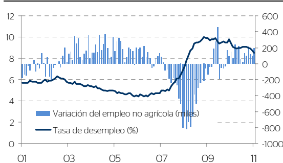
Gráfica 1 Tasa de desempleo y variación del empleo no agrícola