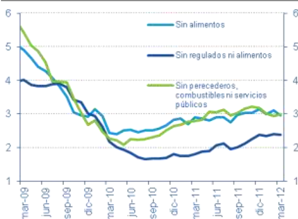
Gráfico 2 Indicadores de inflación básica (% a/a)